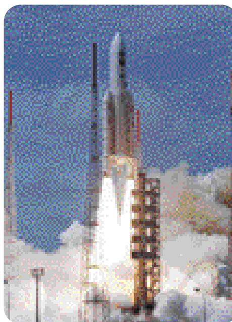
Fusée Ariane 503 au décollage

Les textiles techniques et plus précisément les matériaux composites sont de plus en plus présents dans l'industrie spatiale et aéronautique. Profitant des avancées technologiques dans le spatial, les composites représentent en effet 100 % de la masse de la structure de certains avions militaires et déjà 15 à 20 % de celle des avions civils, une proportion qui ne cesse de croître. Cela concerne surtout les surfaces mobiles (ailerons, volets d'atterrissage, gouvernes, ...), mais aussi le tronçon central de l'Airbus A380. Des gains en poids, en coût de revient et en longévité expliquent ce développement qui conduit à un rapprochement du spatial et de l'aéronautique avec le monde du textile.