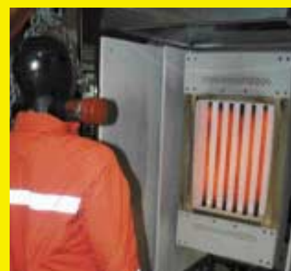
Méthode de mesure EMPA

La température à la surface des vêtements a été mesurée avec une caméra thermographique pendant l'exposition. Les valeurs mesurées variaient selon le type de vêtement et également selon l'intensité radiante de la source. Après une minute d'exposition à 4, 5 et 7.5 kW/m 2 , les températures de surface de tous les vêtements étaient en dessous de 200°C. Par contre à 10kW/m 2 , elles dépassaient 200°C après une minute (donc avant que le seuil de douleur ait été atteint). A cette température, certains matériaux du vêtement commencent à se dégrader. Lors des mesures effectuées, 3 des 9 vêtements ont été endom-